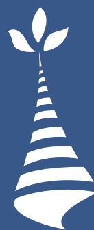
Schéma de coordination, de mutualisation et de spécialisation

Rassembler nos forces pour produire, ensemble, des services publics efficaces, au bénéfice des collectivités bretonnes